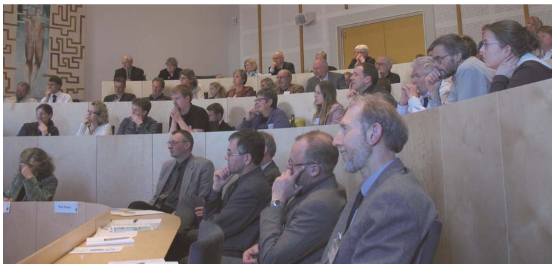
Auditoriet i Syddanske Forskerparker var fyldt til sidste plads ved MiljøForum Fyns årsmøde 2006.

Miljønetværkene kan hjælpe ved at sætte fokus på teknologiudvikling og miljøvenlige produkter i deres samarbejde med uddannelserne og forskningen. Så jeg er glad for at høre, at integration af miljø, uddannelse og erhvervsudvikling står i fokus i MiljøForum